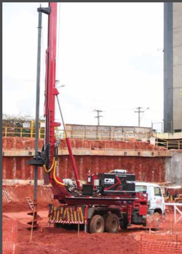
Montada sobre caminhão - Truck mounted

A CZM fabrica uma linha completa de perfuratrizes hidráulicas sobre esteiras e caminhões para fundações como: estaca raiz, hélice contínua, trado mecânico, estacas escavadas e bate estaca hidráulico. Para mais informações consulte: www.czm.com.br