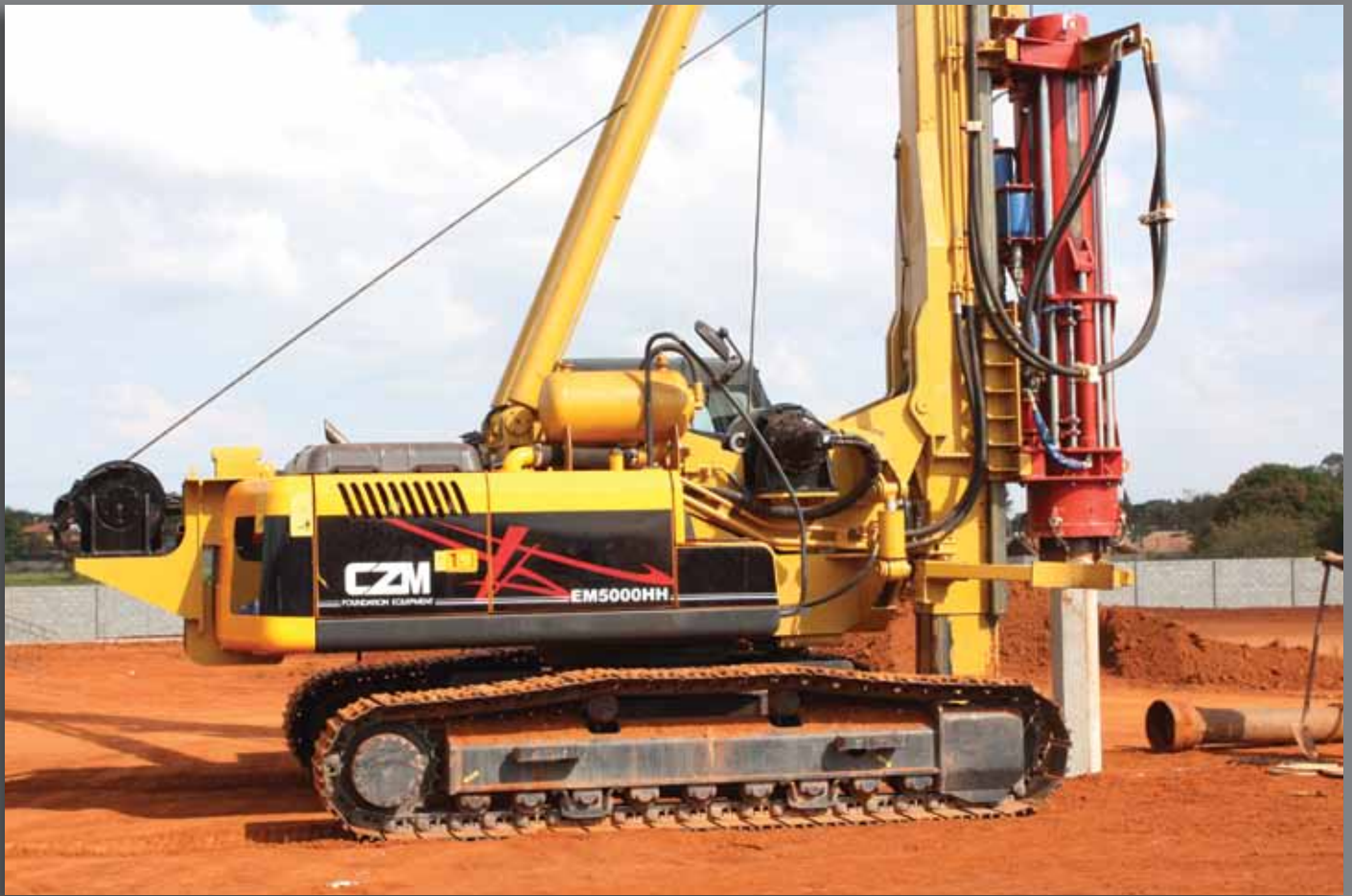
O bate estacas EM5000HH utiliza um martelo hidráulico Fambo-Bauer de pilão de 5.000kg. The CZM EM5000HH uses a Fambo-Bauer hydraulic Hammer of 11.000lb drop weight.